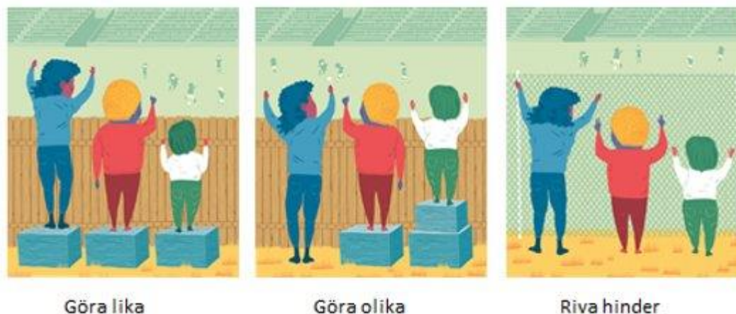
Figur 5: Proportionell universalism.