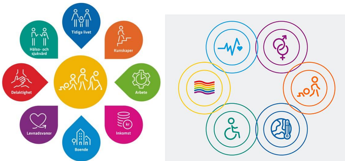
Figur 1 och 2: 8 nationella målområden och tvärpolitiska områden som berör folkhälsa.

Målområdena som beskrivs i bilden nedan till vänster återspeglar hälsans bestämningsfaktorer, det vill säga faktorer som påverkar hälsotillståndet. Tvärsektoriella områden som är viktiga för folkhälsan är funktionshinder, jämställdhet, hbtqi-frågor, barns rättigheter och miljö och klimat, vilket illustreras i bilden nedan till höger. Även nationella minoriteter är ett tvärsektoriellt område.